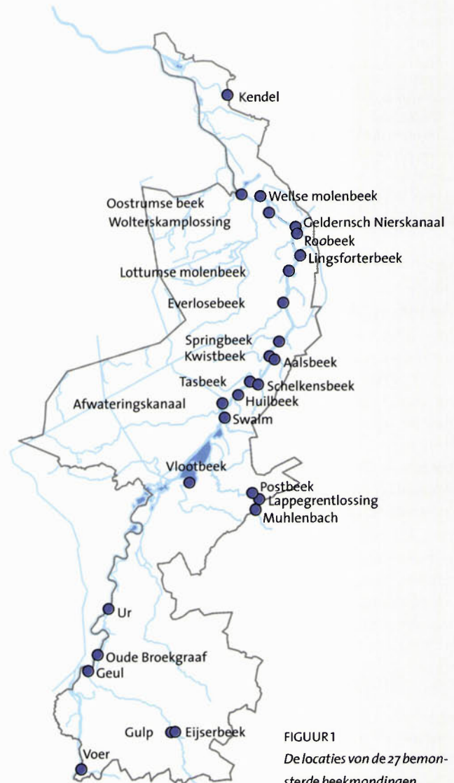
FIGUUR 1 De locaties van de 27 bemonsterde beekmondingen.