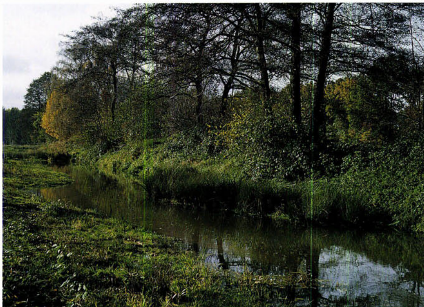
FIGUUR 1 Everlose beek.

In dit artikel trachten wij antwoord te geven op hoe de hoge waargenomen visdiversiteit in beken kan worden verklaard en hoe vissen gebruik maken van de geregleerde laaglandbeken. Hierbij is er gebruik gemaakt van literatuurgegevens en eigen onderzoek naar de voortplanting van vissen in twee geregleerde laaglandbeken uit de Noord-Peel regio. De Everlose beek (figuur 1) is gekozen omdat er een hoge soortenrijkdom is vastgesteld en omdat hij gevoed wordt door Maaswater. De Springbeek is gekozen omdat deze uit eigen bron ontspringt en niet gevoed wordt door Maaswater. De soortenrijkdom en de voortplanting van vissen in de Everlose beek is vergeleken met die van de Springbeek.