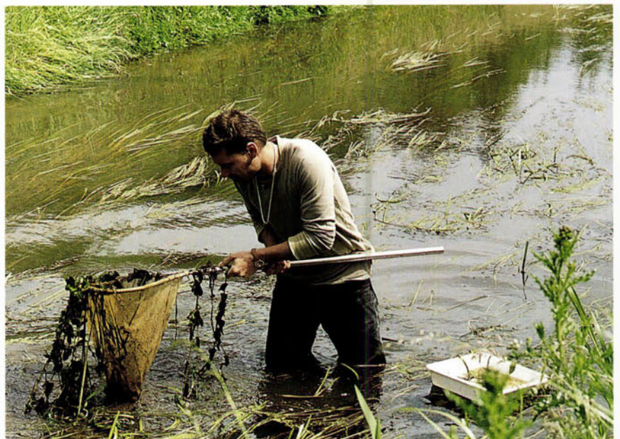
FIGUUR 3 Foto die de wijze van bemonstering laat zien. De inhoud van het schepnet wordt in de witte bak (rechtsonder) overgebracht. In deze witte bak zijn de larven beter te onderscheiden van de modder- en plantenresten.

juni en één maal in augustus op twee vaste locaties bemonsterd. De Everlose beek daarentegen, werd bijna wekelijks op een groot aantal verschillende locaties bemonsterd, waarbij zoveel mogelijk verschillende beektrajecten (zowel meanderende als genormaliseerde stukken) bemonsterd werden (figuur 3). Bij de bemonstering werd gebruik gemaakt van een fijnmazig (1,0 mm) schepnet (60x40 cm). Vangsten zijn meegenomen voor